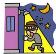
センサーライトをつける