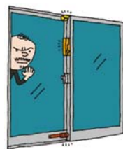
玄関や窓の鍵を増やす