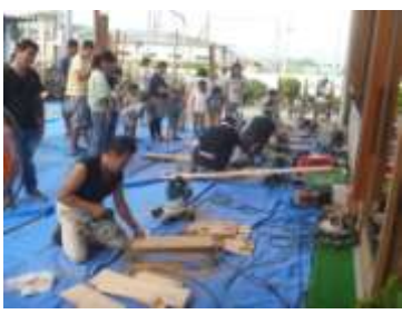
↑大工四人が木材を切断