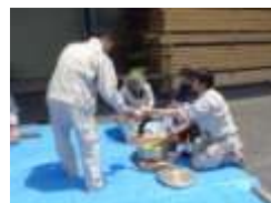
↑豚汁美味しかった？

次は田植えです☆裸足で田んぼに入って、苗を植えていきます。泥なので足元がふらつきます。しっかり植えないとイネも成長しません！頑張れ～！社員も一緒に田植えをさせて頂き、