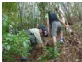
↑頑張って掘りました！

どんな料理になったのかな？ 採りたての新鮮なタケノコは、えぐみがないので本当に美味しいです(pq´v`*) 天ぷら、炊き込みご飯、煮物etc . . .