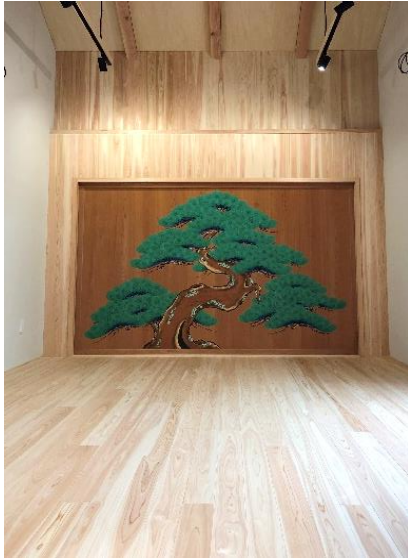
↑老松の鏡板が見事な能舞台