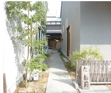
↓両玄関のお庭 (工事途中)