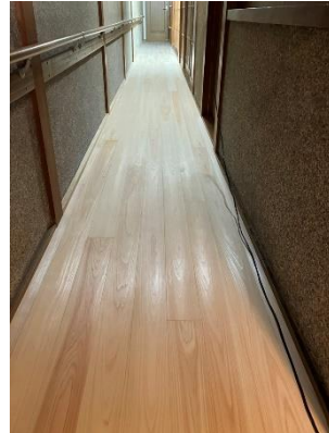
↑新しくなった桧の廊下

「家（壁や床）に隙間ができています！」と感じたら土台や柱に原因があって、お家が傾いていることもあります。気になる時は、ぜひご相談ください。