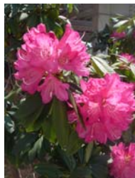
会社のジャクナゲ↑

皆様におかれましても、益々ご健康に充実した日々を過ごされますようお願いしております。