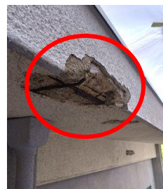
↑モルタルが剥がれています

このまま放置しておくと、鉄骨はボロボロになり、崩落してしまう危険性もあります。原因は、目に見える箇所でない時もあります。